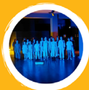
CORO DE CÂMARA PEVIDÉM