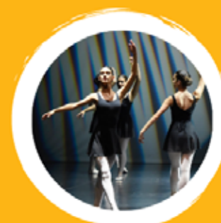
ACADEMIA DE BAILADO GUIMARÃES