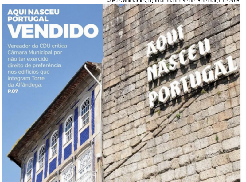
© Mais Guimarães, o Jornal, manchete de 15 de março de 2016

Por isso, “hoje os vimaranenses e todos os que nos visitam têm à sua disposição mais um monumento de importância histórica para visitar. Do alto da Torre da Alfândega, um edifício público, será possível vislumbrar uma parte da cidade que viu nascer um país. Que todo o concelho de Guimarães possa assumir esse património ímpar. Valeu a pena lutar,” termina a CDU. •