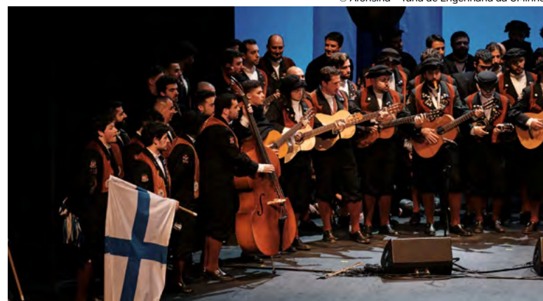
© Afonsina - Tuna de Engenharia da UMinho

São à volta de 400 participantes que constatarem uma forte adesão, no Largo da Oliveira e no Grande Auditório do Centro Cultural Vila Flor. Além da tuna anfitriã e de cinco grupos culturais da academia minhota, este ano vão participar tunas de Lisboa, Porto, Vila do Conde e Coimbra.