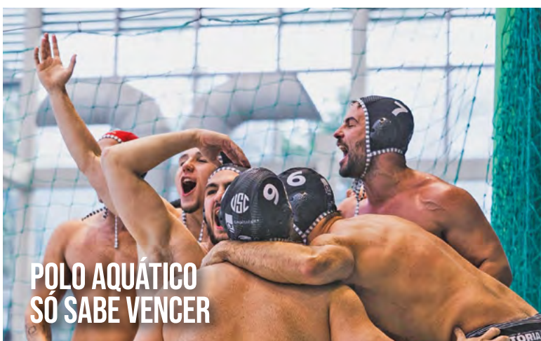
POLO AQUÁTICO SÓ SABE VENCER