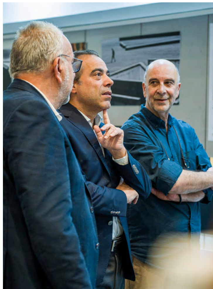
A exposição no GuimarãesShopping teve o apoio da Muralha - Associação de Guimarães para a Defesa do Património.

Em 1991, foi selecionado pela KODAK Europa para a apresentação de novo material fotográfico, e em 1992 representou Portugal na obra internacional “The Art Photographer’s Book”. Ao longo dos anos, participou em exposições em Lisboa, Porto e Guimarães, com destaque para o Palácio Foz, Palácio da Bolsa e Pousada de Santa Marinha da Costa. As suas imagens foram ainda dis-