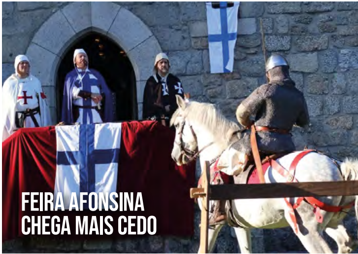
FEIRA AFONSINA CHEGA MAIS CEDO

TODOS OS MESES A MAIS GUIMARÃES LEVA ATÉ SI O QUE DE MAIS IMPORTANTE ACONTECE NA CIDADE BERÇO E NO CONCELHO!