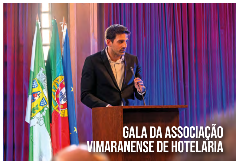
GALA DA ASSOCIAÇÃO VIMARANENSE DE HOTELARIA