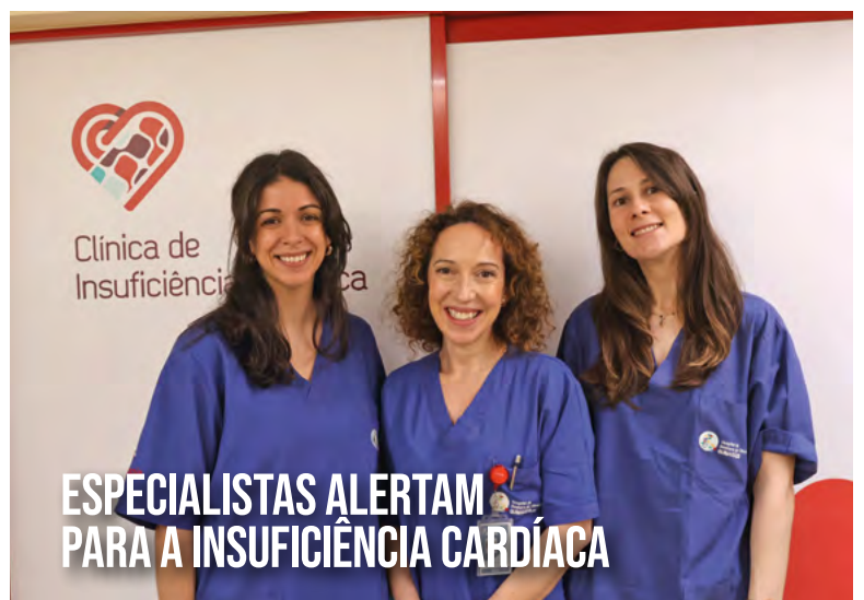
ESPECIALISTAS ALERTAM PARA A INSUFICIÊNCIA CARDÍACA