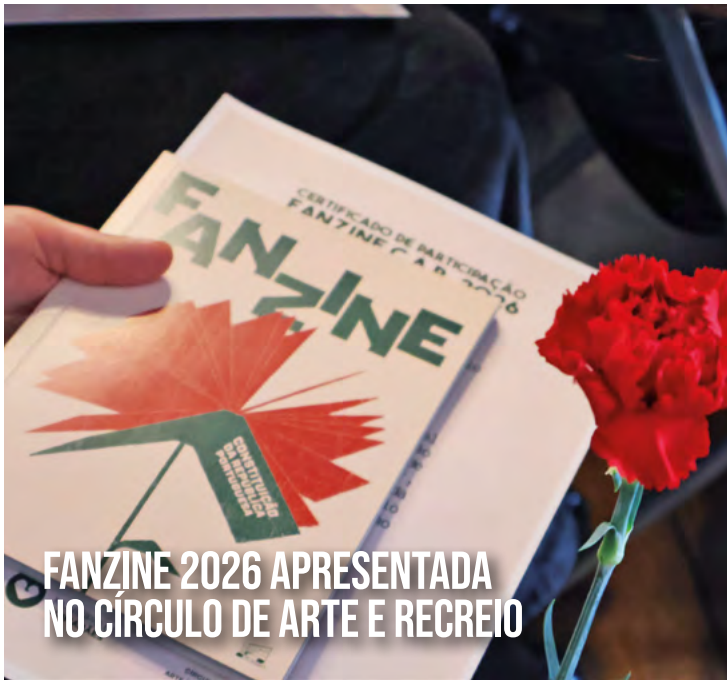
FANZINE 2026 APRESENTADA NO CÍRCULO DE ARTE E RECREIO