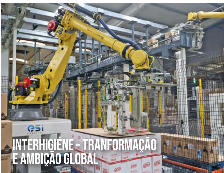
INTERHIGIÊNE - TRANSFORMAÇÃO E AMBIÇÃO GLOBAL