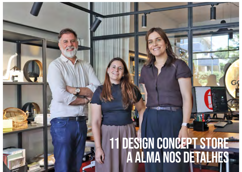
11 DESIGN CONCEPT STORE A ALMA NOS DETALHES