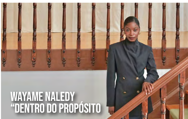
WAYAME NALEDY "DENTRO DO PROPÓSITO"