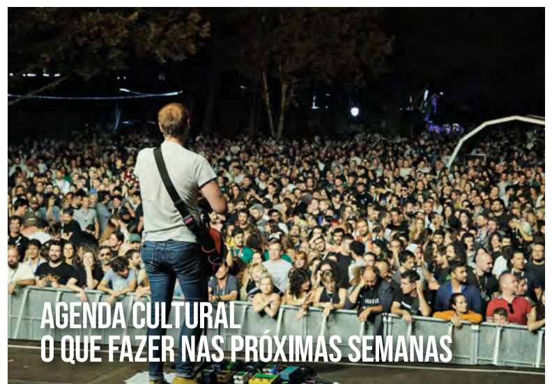
AGENDA CULTURAL O QUE FAZER NAS PRÓXIMAS SEMANAS