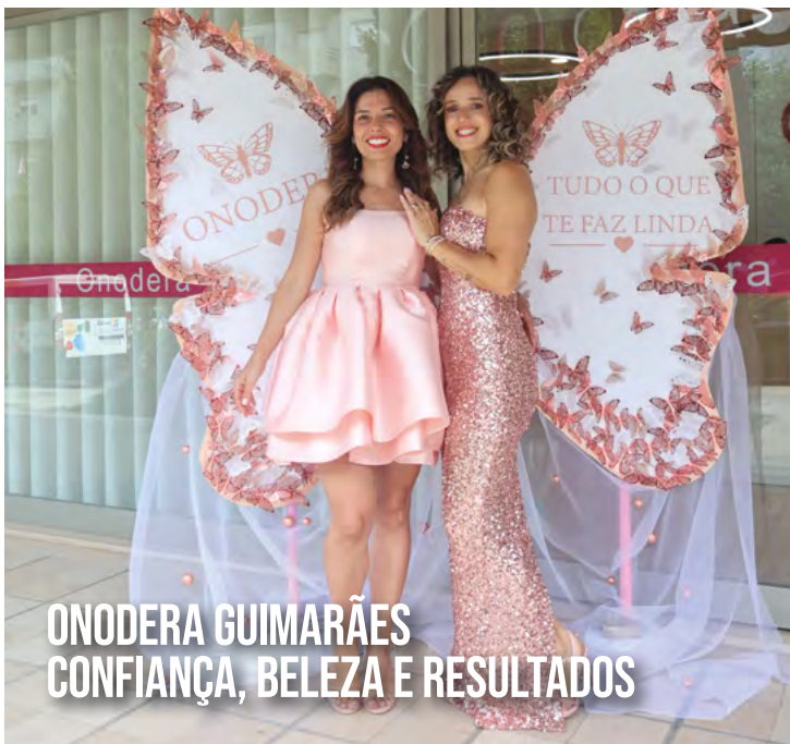
ONODERA GUIMARÃES CONFIANÇA, BELEZA E RESULTADOS