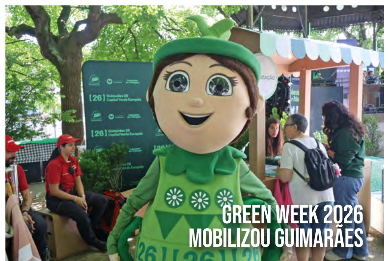
GREEN WEEK 2026 MOBILIZOU GUIMARÃES