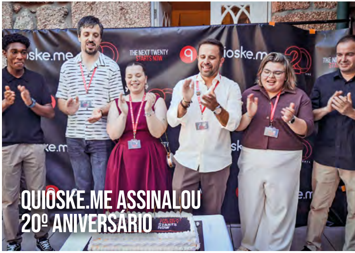
QUIOSKE.ME ASSINALOU 20º ANIVERSÁRIO

TODOS OS MESES A MAIS GUIMARÃES LEVA ATÉ SI O QUE DE MAIS IMPORTANTE ACONTECE NA CIDADE BERÇO E NO CONCELHO!